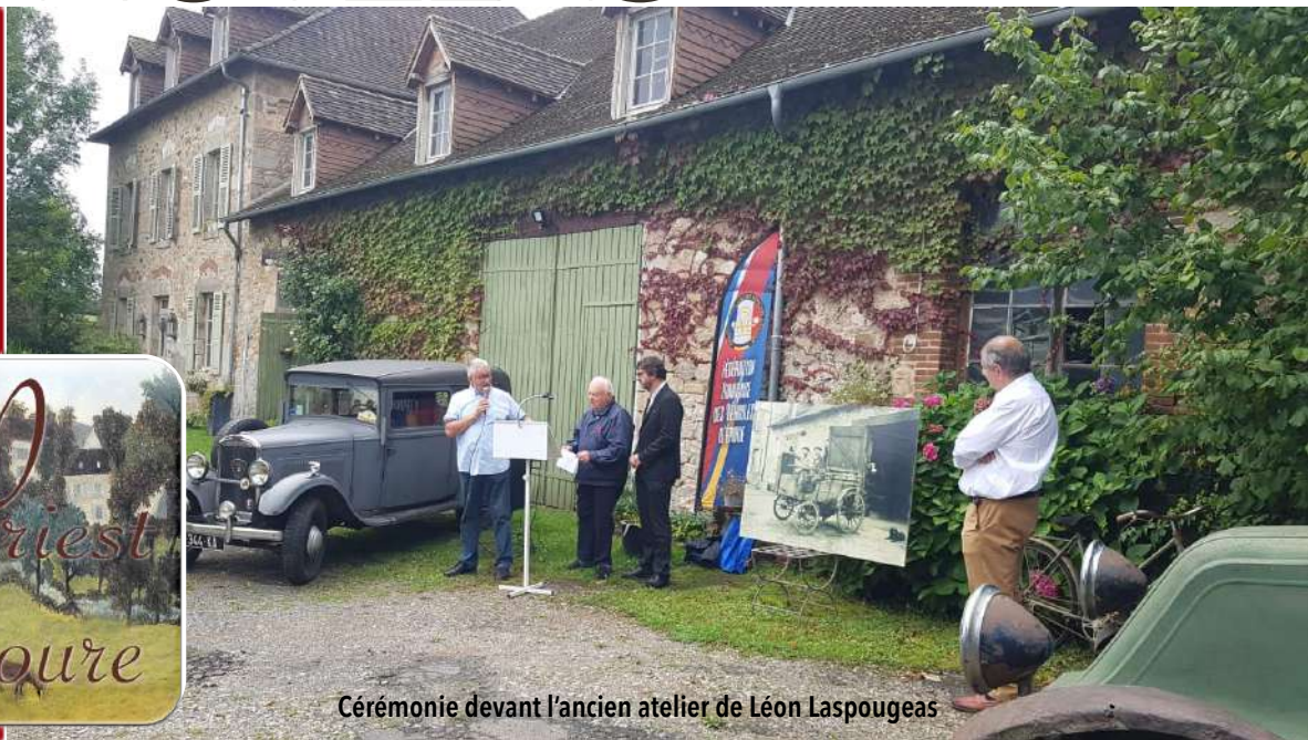
Cérémonie devant l'ancien atelier de Léon Laspougeas