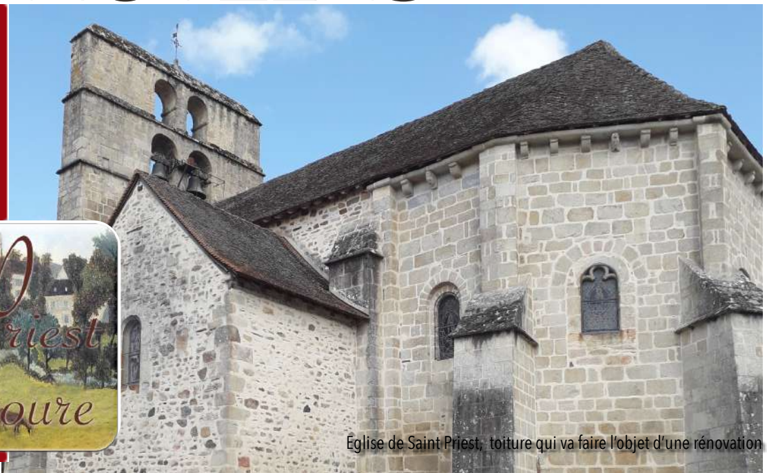
Eglise de Saint Priest, toiture qui va faire l'objet d'une rénovation