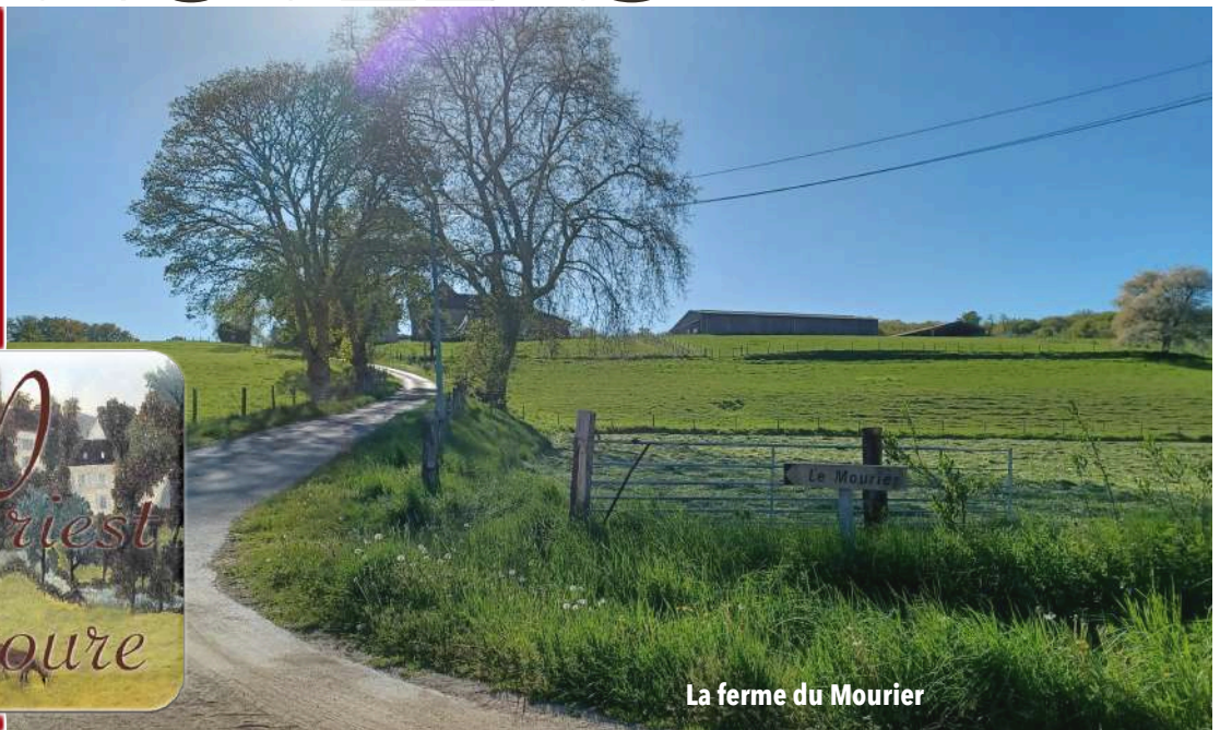
La ferme du Mourier