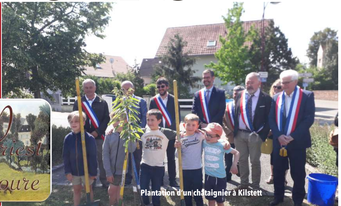
Plantation d'un châtaignier à Kilstett