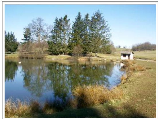
Photo ci-contre : une vue générale de l'étang Royer sur la commune de St-Priest-Ligoure,.

Monsieur le Président a remercié les élus des municipalités pour le versement annuel d'une subvention