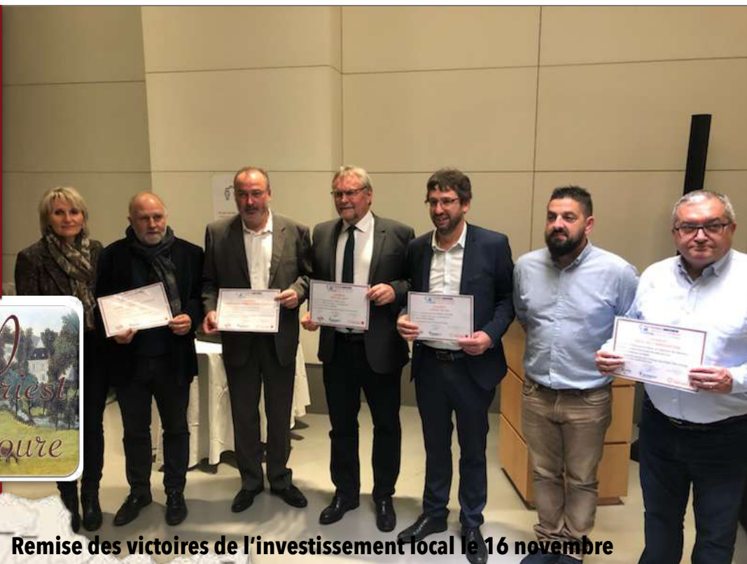
Remise des victoires de l'investissement local le 16 novembre