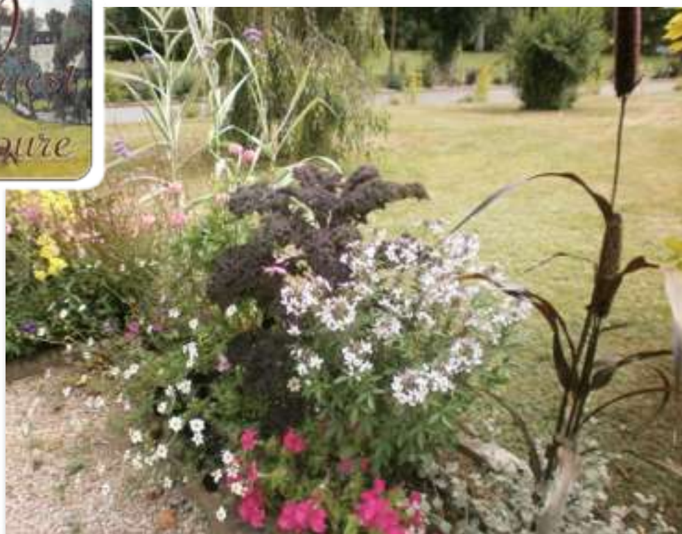
Fleurissement, jardin des écoliers