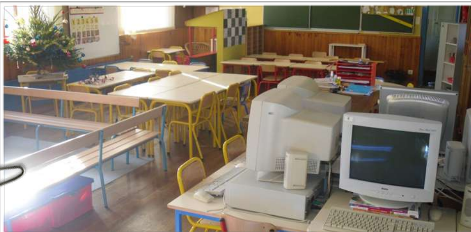
Classe de Mme DURIEUX