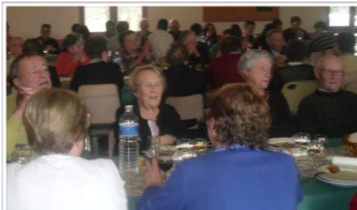
Repas des aînés

Plus de 70 d'entre eux ont répondu présent. Toute l'équipe municipale, élus, salariés, et personnels se sont attachés à servir et participer au rapprochement entre tous