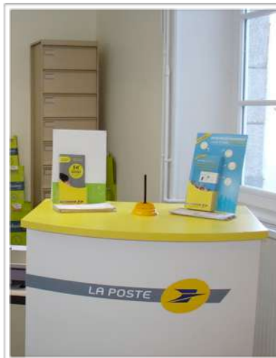
La poste de St Priest Ligoure