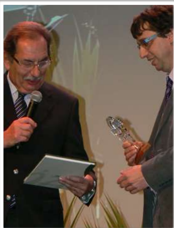
Remise du 1 er prix des rubans verts catégorie collectivités locales

Pour plus d'informations: http://www.tourisme-hautevienne.com/IMG/pdf/livret_palmares_fleurissement.pdf