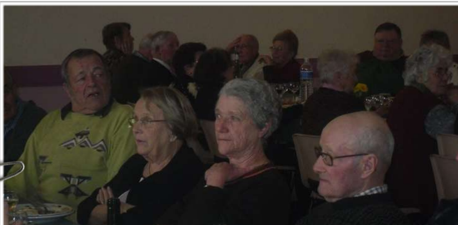
Repas des aînés