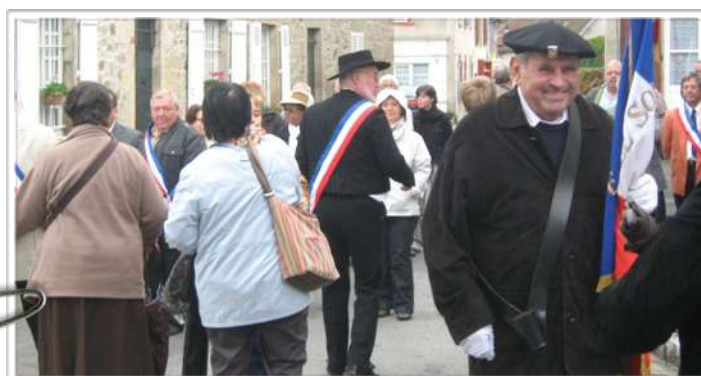
Dépôt de gerbes au monument aux morts

Les Etats doivent réduire leur dépense, la croissance étant faible, ce sont les budgets d'investissement