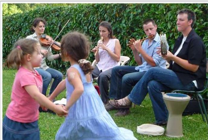
Soirée musique de chambre

«Les Passeurs d'Histoires». Elle se poursuivra en 2011 avec de nouveaux lieux et de nouveaux contes thématiques. Le prochain sera à la Bibliothèque en février 2011.