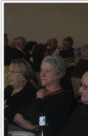
Repas des aînés

publics ou privés qui subissent les fortes baisses, car facilement ajustables, maintenant ainsi une croissance molle et donc peu de créations d'emplois.