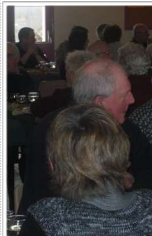
Repas des aînés