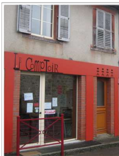
Le comptoir, le lieu....