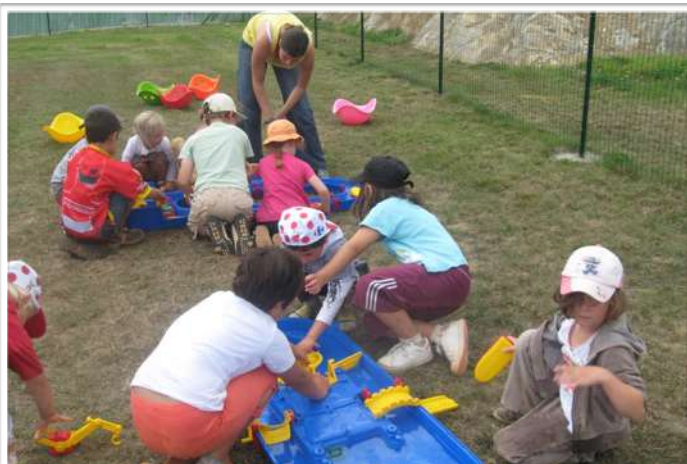
Animation enfant, La Roulotte

Vous pouvez nous contacter par mail: contact.laroulotte@gmail.com .