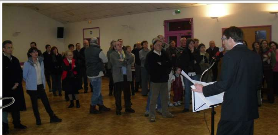
Présentation des vœux par Mr le Maire