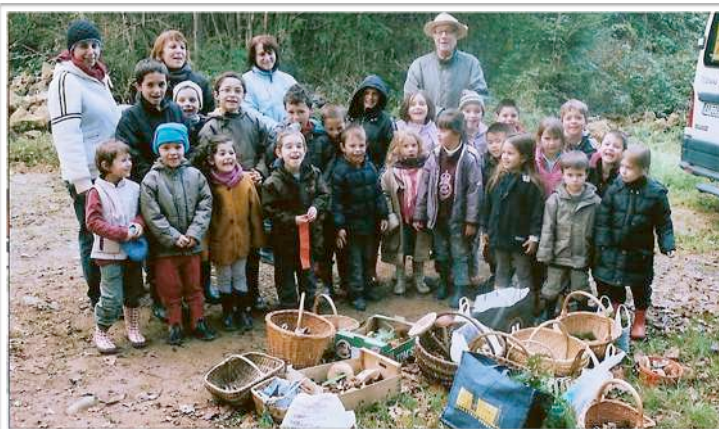
A la découverte des champignons