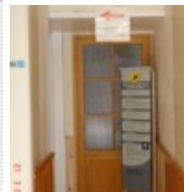
l'agence au fond du couloir

Venez utiliser les services de l'agence postale localisée dans les locaux de la mairie.