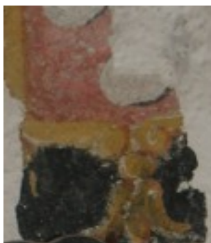
Décoration murale de l'église

L'église de St Priest Ligoure est inscrite à l'inventaire supplémentaire des monuments historiques par arrêté ministériel du 11 Octobre 1982. L'édifice s'inscrit dans un relief marqué dont la pente Est-Ouest vient s'achever une cinquantaine de mètres plus bas dans le cours d'eau de la Ligoure. La nef s'adosse à une maison d'habitation au Nord l'ancien presbytère, alors que la chapelle et la sacristie ouvrent sur le jardin voisin. Plusieurs campagnes de restauration de l'église ont permis : de 1981 à 1986 la remise en état des parements extérieurs, puis de 1989 à 1999 la restauration des parements intérieurs des chapelles Nord et Sud ainsi que des vitraux. En 2010, nous avons décidé de poursuivre le travail de restauration de l'édifice avec une première tranche de travaux ayant conduit au suivi et au remaniage de la couverture ainsi que la réalisation d'un état des lieux des décorations murales mettant à jour l'existence de décors peints d'une valeur historique non négligeable.