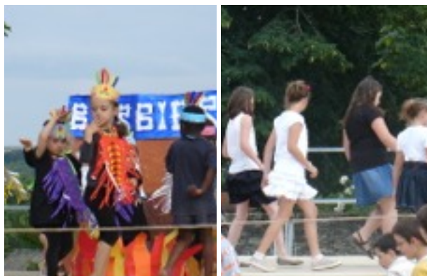
Classe de moyenne section de maternelle (gauche) et CM2 (droite)